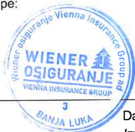
Daliborka Dedić Izvršni član Upravnog odbora